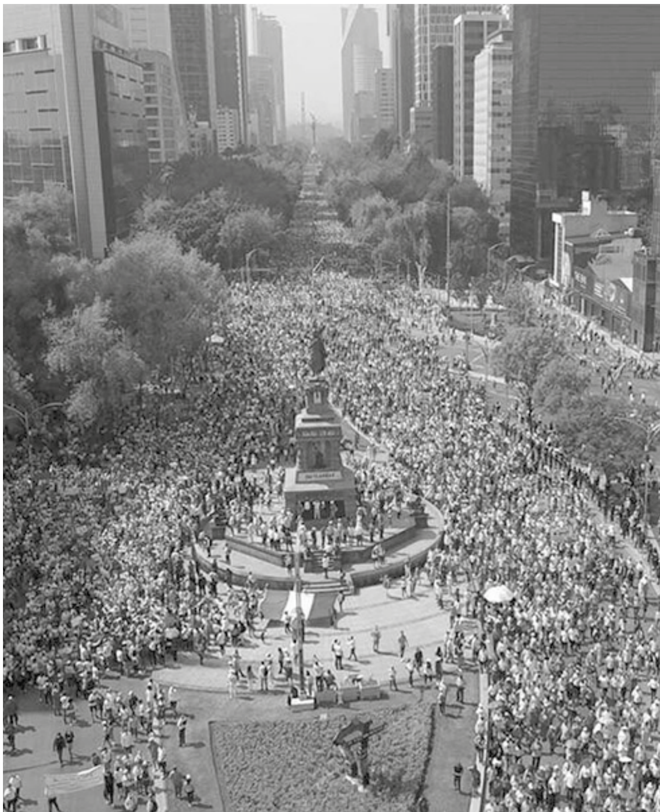
Marcha del 13 de noviembre en apoyo al INE.