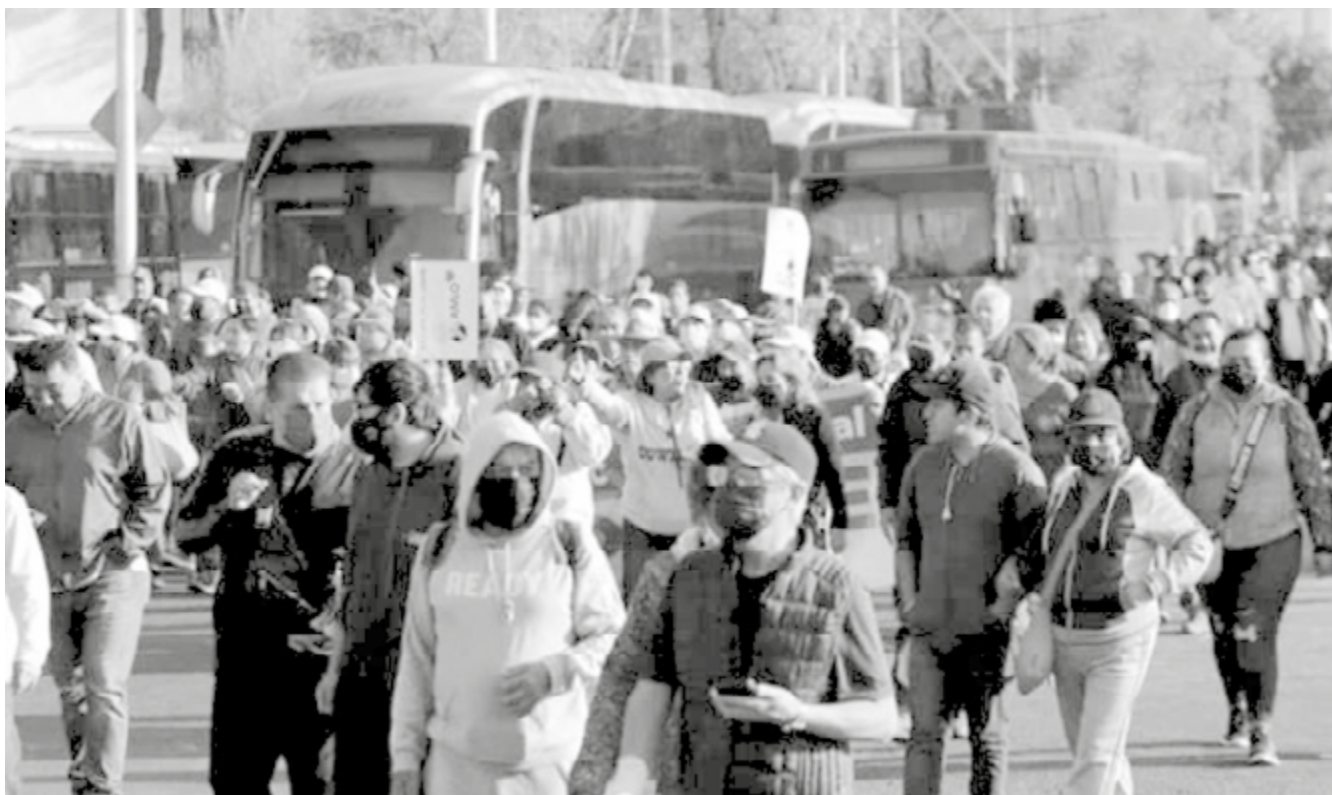
Miles de acarreados a la marcha de AMLO.

tocó su turno al expresidente Felipe Calderón, a quien no bajaron de alcohólico, llegando incluso con Carlos Salinas, a quien acusaron de vender al país a los extranjeros. López Obrador aseguró el viernes 25 que a la marcha del domingo 27 de noviembre está invitado todo el pueblo, “solo nos reservamos el derecho de admisión para provocadores y violentos”.