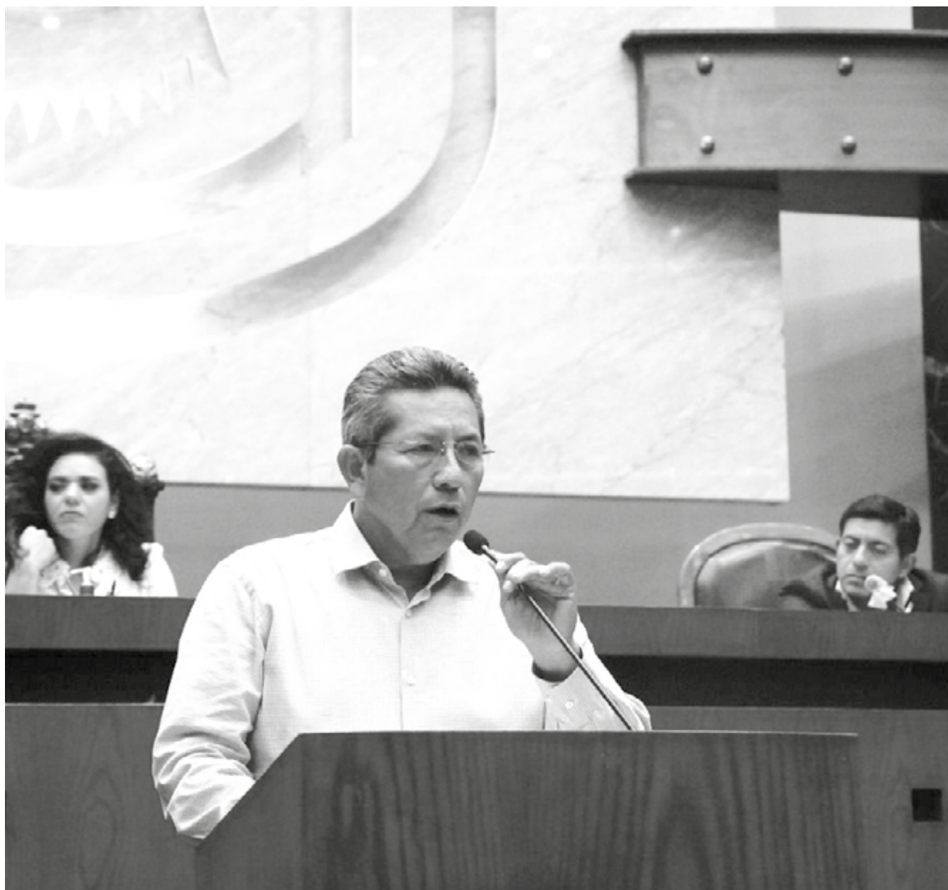
El diputado Carlos Reyes Torres. Rechazo a la reforma electoral de AMLO.