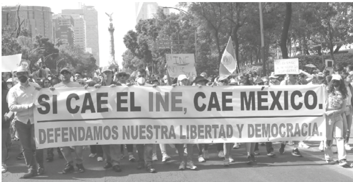
La marcha ciudadana organizada por PRD-PRI-PAN contra el autoritarismo de AMLO.

direcciones municipales; en algunos municipios de la entidad ya han sido ratificadas sus direcciones municipales”.