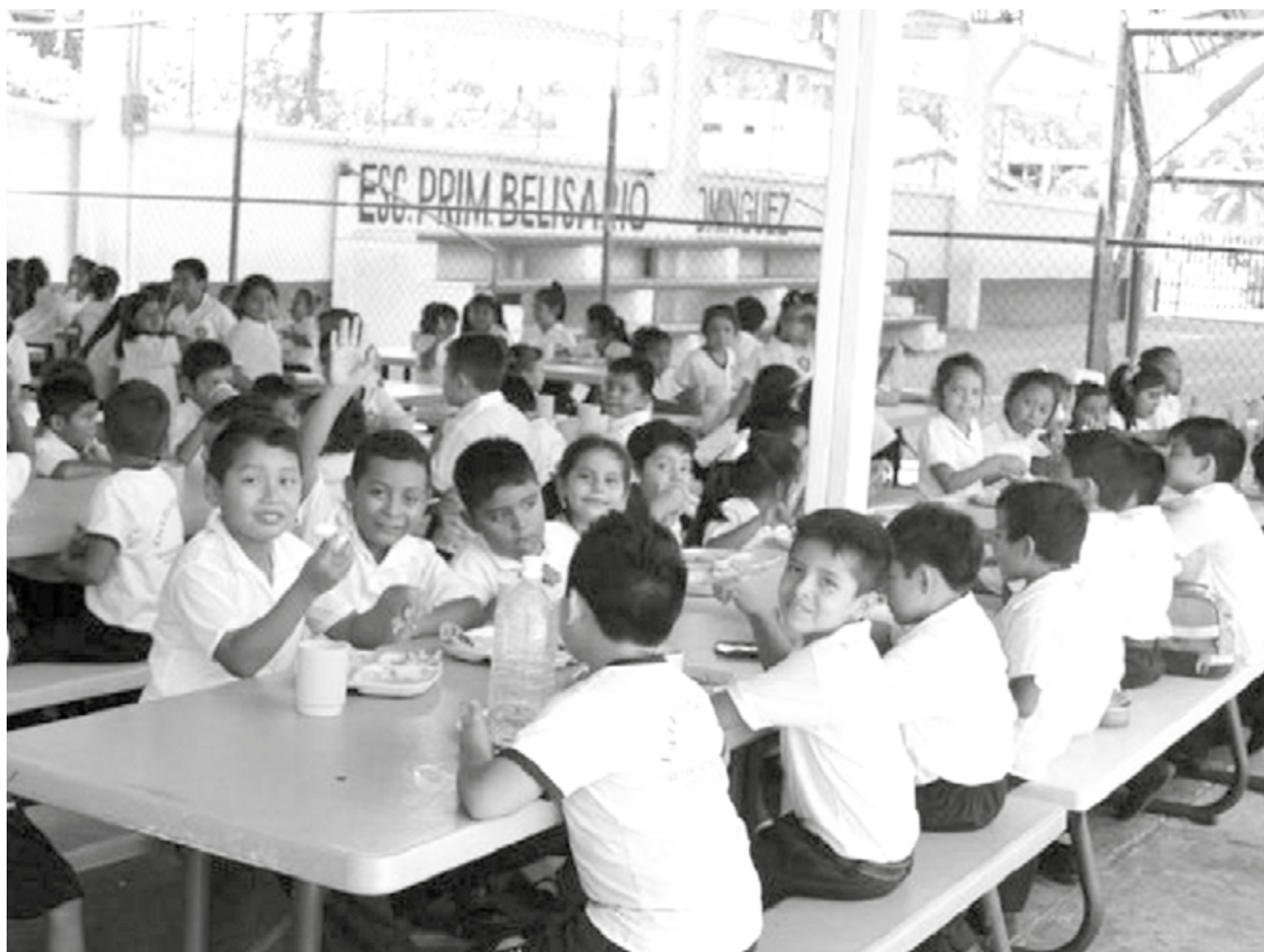
La 4T desapareció las escuelas de tiempo completo.