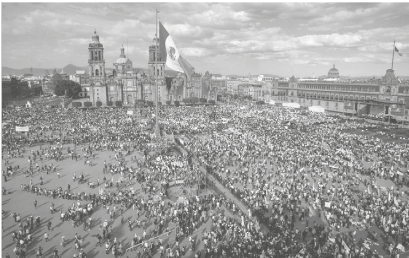
Ni con todo el aparato de Estado, logró López Obrador llenar el zócalo de la Cdmx.

jóvenes; de las graderías le dieron las gracias un grupo de personas de la tercera edad. “Jóvenes de corazón”, grita un hombre vestido como los motociclistas de las películas de la década de 1970.