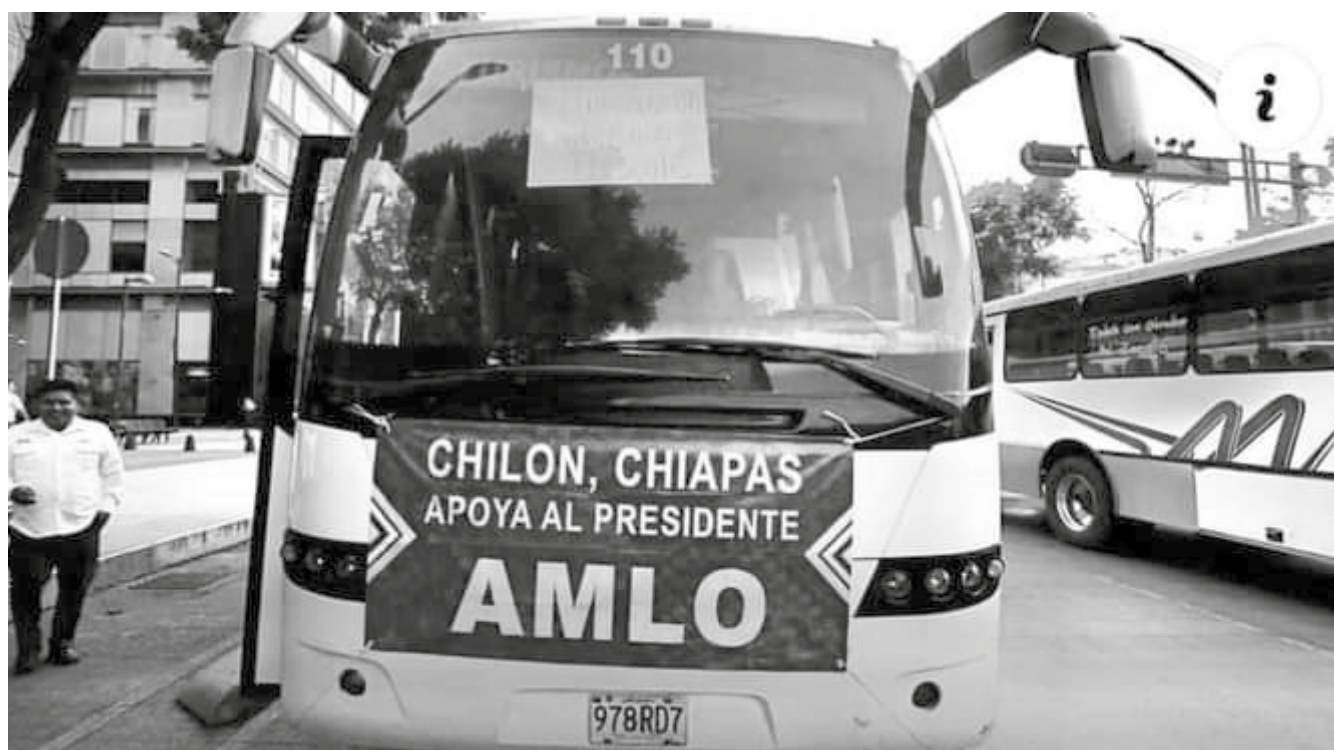
Cientos de autobuses provenientes de todo el país llegaron a la marcha de López Obrador.

Una marea humana deposita al presidente de la República en el zócalo poco después de las 16 horas. Toma aire y da un mensaje extenso. Lo primero que resaltó que lo que le llamó más la atención de la marcha fue la mayoría de participantes eran